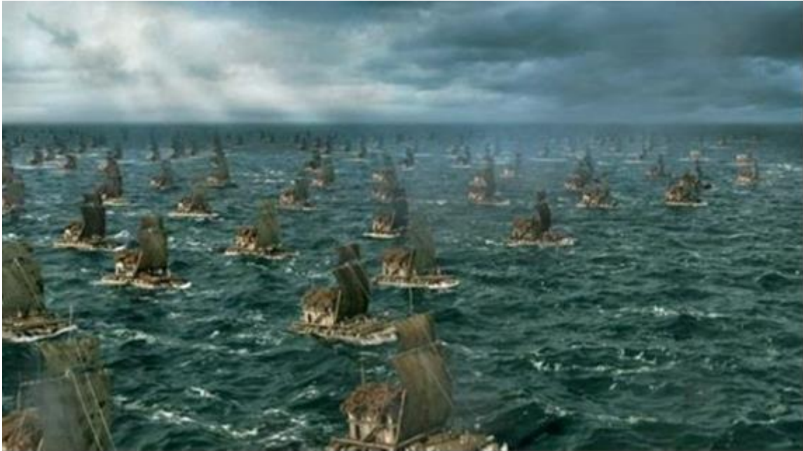
Фиг. 1 Флотилията на Тупак Инка Юпанки

Тупак Инка Юпанки е син на Пачакутек и мама Анауарке. Когато навършва 16 години, съветът на мъдреците – старейшини – го избира за багрянороден наследник и баща му Пачакутек - го назначава за съзар. Тупак Юпанки оправдава напълно оказаното му доверие, от тази крехка юношеска възраст той се доказва като роден воин, непобедим завоевател и любознателен пътешественик. Тупак Юпанки разширява границите на империята на Инките и по време на неговото царуване Тауантинсуйу достига най-голямо териториално разширение и блясък. Условно можем да разделим живота и завоеванията му като Император на Инките на три периода – завоевания по суша, презокеански Велики Географски Открития, избор на съзар – наследник.