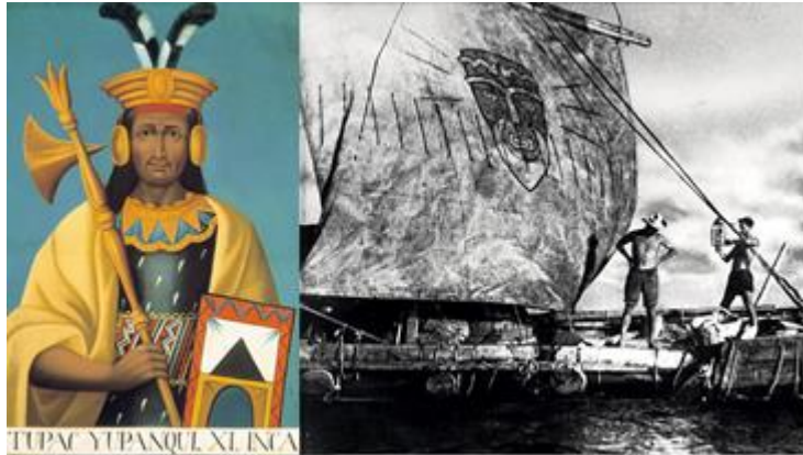
Фиг. 5 Тупак Инка Юпанки (вляво) и Кон-Тики на Тур Хейердал (вдясно)

По този начин, аз ви представих накратко моят пра-прадядо Тупак Инка Юпанки, Великолепният, Най-големият войн, Най-великият Пътешественик и Откривател, роден от индианските нации в Америка.