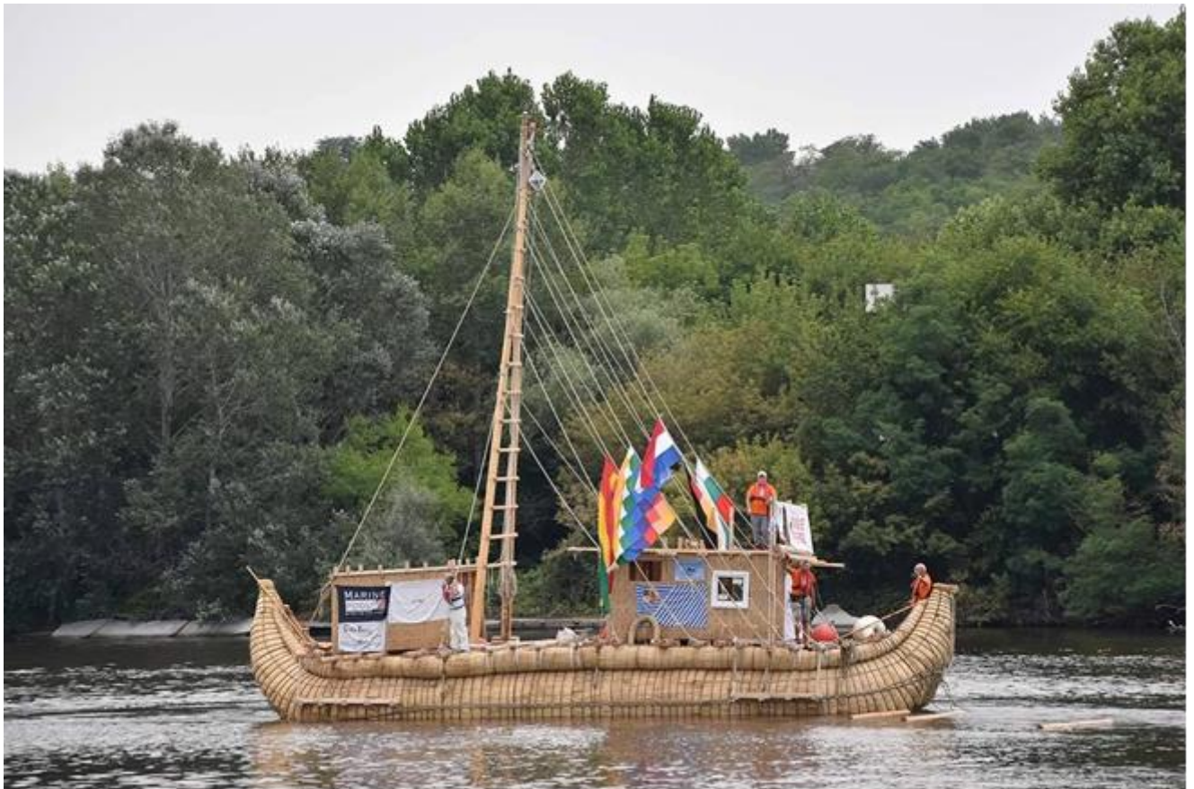
Фиг. 6 Мисия ABORA IV