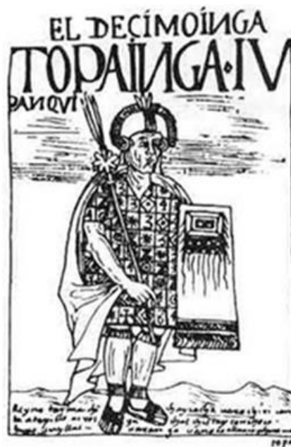
Фиг. 2 На изображението Тупак Инка Юпанки: / Imagen de Guaman Poma de Ayala en „Nueva crónica y buen gobierno“ (1615)

Тупак Инка Юпанки е син на Пачакутек и мама Анауарке. Когато навършва 16 години, съветът на мъдреците – старейшини – го избира за багрянороден наследник и баща му Пачакутек - го назначава за съзар. Тупак Юпанки оправдава напълно оказаното му доверие, от тази крехка юношеска възраст той се доказва като роден воин, непобедим завоевател и любознателен пътешественик. Тупак Юпанки разширява границите на империята на Инките и по време на неговото царуване Тауантинсуйу достига най-голямо териториално разширение и блясък. Условно можем да разделим живота и завоеванията му като Император на Инките на три периода – завоевания по суша, презокеански Велики Географски Открития, избор на съзар – наследник.